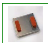
Dimensione piatto mm.60x20 x 2pz.

È possibile sostituire i piatti "standard" con i seguenti Kit (ogni kit è composto da 2 pz.):