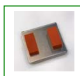
Dimensione piatto mm.70x30 x 2pz.