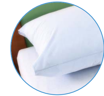
Morbidezza, freschezza, assenza di pieghe anche per il guanciale che completa la gamma con salvaguanicali e federe della stessa tecnicità.